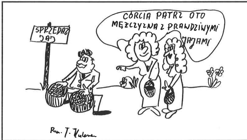
Rys. J. Kulesza

Tu skubnie, tam wyszarpane i dla potrzebujących zawsze uzbiera. Jak ktoś nie może znaleźć roboty, to niech mu płacą i całe życie. Co mnie obchodzi jakaś giełda? Władek na to, że takich chętnych, co się ich żadna robota nie ima, jest na pęczki. Zna też takich, co i kuroniówkę biorą i w Belgii na robotach siedzą, albo takich, co mają własny biznes i zatrudniają ludzi, a dzieciaka po skończeniu szkoły po kuroniówkę, a raczej już millerówkę, wysyłają. Że są i tacy, co tylko po to idą do roboty, żeby po pół roku ją rzucić i "apiać" brać przez rok zasiłek. Ja mu na to, że co ludziom żałować, jak się należy. Rząd wie, co robi i niech ten minister z rudą brodą się nie miesza. Zabrać tym bogatym, przysolić im takie podatki, żeby wszystkim starczyło. Zdążył jeszcze Władek na odchodnym powiedzieć, że to rozdawanie pieniędzy tak działa na ludzi, że jedna kobieta złożyła do urzędu w Zambrowie podanie, żeby jej dali bezzwrotną zapomogę 200 milionów, bo nie ma za co kupić glazury i boazerii do wykończenia budowanego domu. Dlaczego nie? Chodzi ostatnio po mieście taki łebski gość i namawia ludzi, żeby pisali do urzędu o pieniądze. Rozmawiał ja z nim i on mnie powiedział krótko i "wenzłowato": pisz, to dostaniesz. Żeby jeszcze ten Miller lepiej się starał, to będzie super. A Władek to ciemniak.